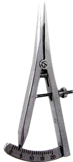
カストロカリパー